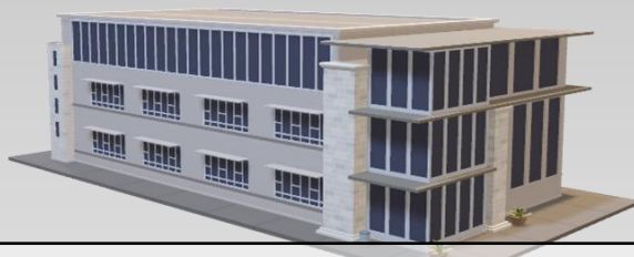
Оценка стоимости недвижимости специального назначения (промышленных объектов)