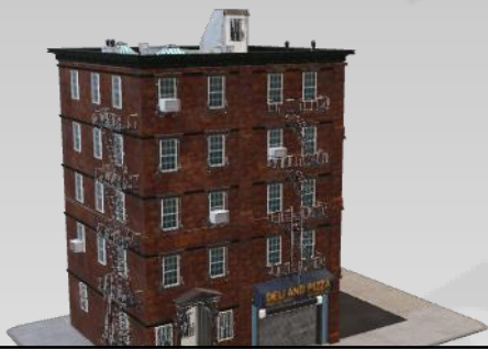
Оценка стоимости жилой недвижимости