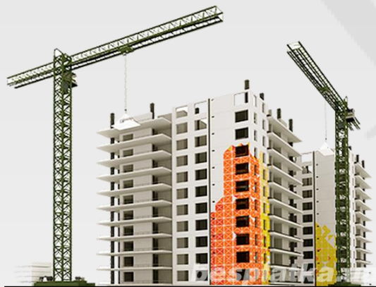
Оценка незавершенного строительства