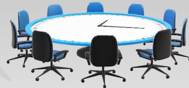
Оценка стоимости бизнеса