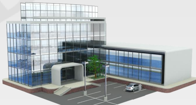
Оценка коммерческой недвижимости